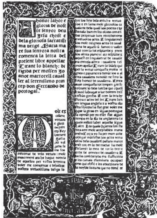
Primera pàgina de la primera edició del llibre, publicada a València al 1490

Ja durant el mes d'octubre, a la mateixa localitat de Gandia, ha estat exposada una col.lecció exhaustiva de les diferents edicions del llibre de Martorell en la qual també hi han col.laborat la Generalitat de Catalunya a través de la Biblioteca de Catalunya i la Institució de les Il·tres Catalanes. En la mostra hi figurava un dels tres exemplars que es conserven de la primera edició del 1490, cedit per la Biblioteca de la Universitat de València, el valor del qual sobrepassa els 70 milions de pessetes. Els altres dos originals del 1490, impresos a València en els tallers de Nicolau Spindeler, són en museus a Londres i a Nova York. També hi ha una traducció francesa del 1733, editada a Londres, i diverses edicions en anglès, romanès, portuguès, alemany, holandès i italià, a part de totes