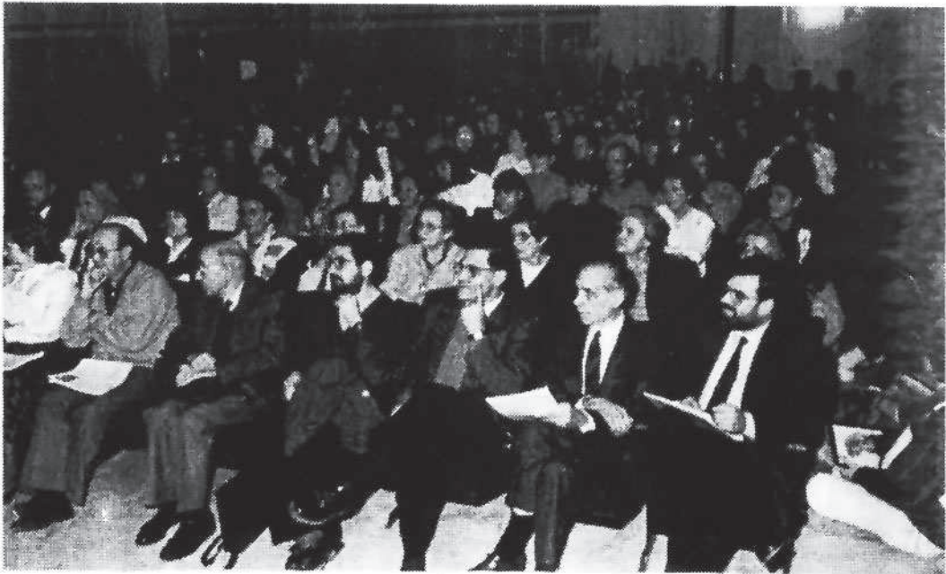
La Sala de la Caixa de Pensions va resultar insuficient -285-