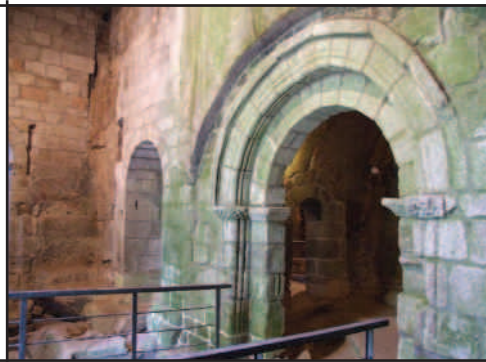
San Pedro de Rocas (Esgos).