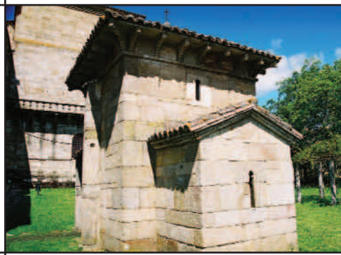
San Miguel de Celanova.

Viatge d'estiu dels AARB. Juliol de 2007