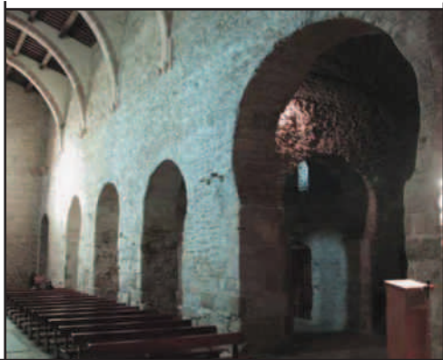
Sant Miquel de Cuixà (el Conflent)

- L' opus spicatum , aparell mural format de pedres allargassades, disposades en inclinació obliqua i en rengles oposats de sentit, formant una línia en espina de peix, ja era usat des de l'època romana (segons Puig i Cadafalch), molt freqüent en els edificis rurals preromànics, molt rar en els romànics, i, en èpoques posteriors, en construccions senzilles es torna a utilitzar. Per exemple en pobles del Pallars Sobirà, Alt Empordà, Vallès, etc. es pot trobar en construccions dels segles XIV al XVII. Per tant, no pot acceptar-ne com a preromànica una paret per la sola presència de l' opus spicatum .