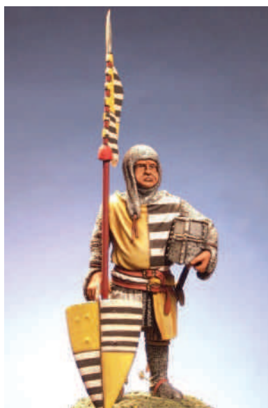
PEGASO MODELS (ITÀLIA) Escultors: L. Marchetti & M. Venturi Pintor: Paco Ariza

Aquest cavaller es protegeix amb un gonió, proveït de caputxa de malla, que també cobreix els braços i les mans, que són resguardades amb uns guants semblants a mitenes. Normalment mostraven unes obertures, a manera de talls longitudinals, que permetien, com en el cas d'aquest cavaller, de treure les mans i deixar-les lliures. Les cames, per la seva part, són protegides amb calces de malla, sobrecobertes a l'alçada dels genolls i de les cuixes amb uns reforços de roba enconxada, sense descartar que siguin de cuir. Els peus, atesa la seva condició de cavaller, són calçats amb esperons, en aquest cas molt llargs, proveïts de rodetes.