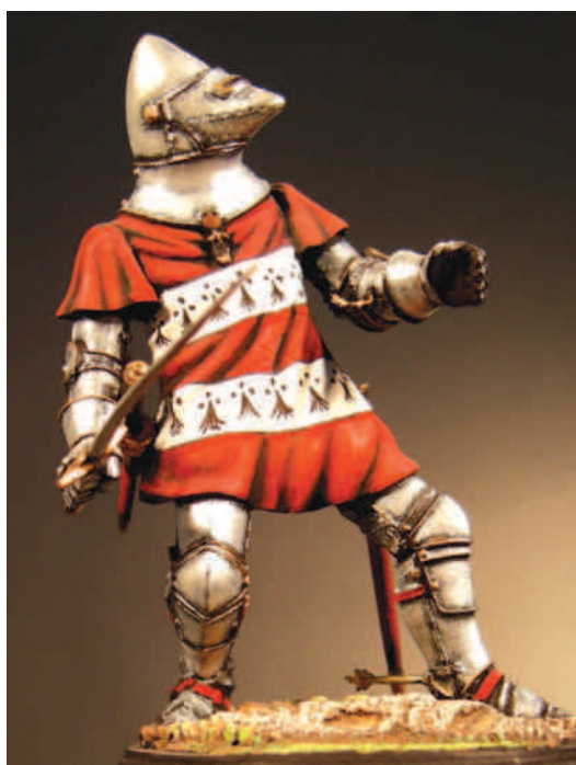
PEGASO MODELS (ITALIA) Escultors: L. Marchetti & M. Venturi Pintor: Paco Ariza

Cavaller francès que fou mort a la batalla d'Azincourt (o Agincourt) que tingué lloc el 1415 en el context de la guerra dels Cent Anys (1337-1453). En aquesta ocasió, l'exèrcit d'Enric V d'Anglaterra derrotà, contra tot pronòstic, les tropes franceses, comandades per Carles VI, que eren molt superiors en nombre.