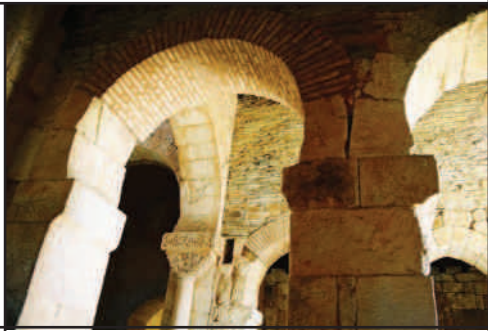
San Pedro de la Nave (Zamora).