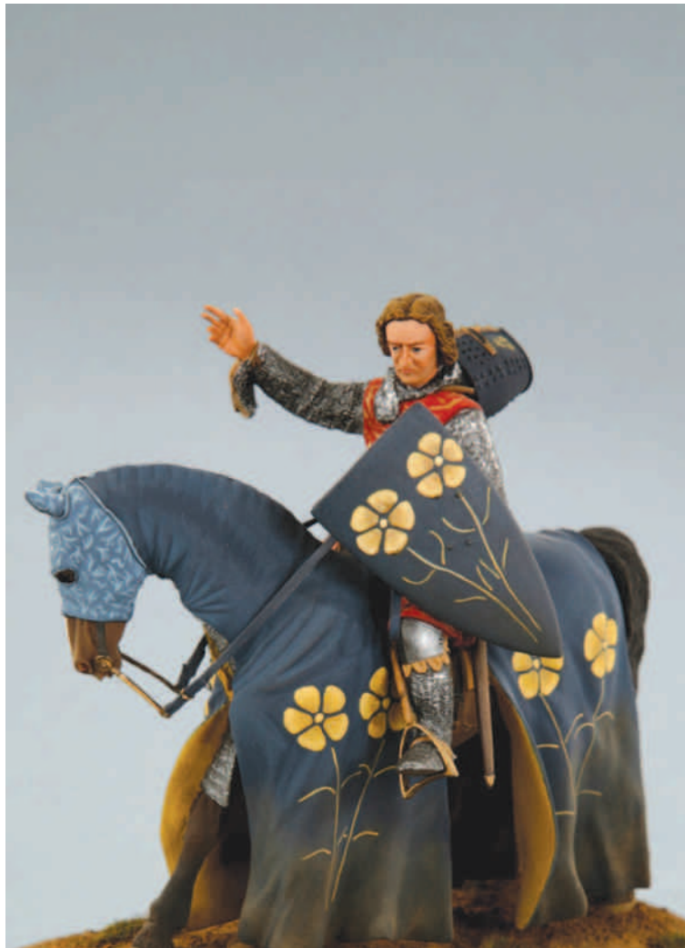
Cavaller de la família Pellari (segona meitat del segle XIII) EMI (Itàlia)