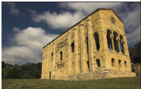
Santa María del Naranco (Oviedo)

És digne d'esment l'aparició de monestirs als contraforts pirinencs, que adopten principalment la regla benedictina, dependents del bisbat d'Urgell, els quals van assolint nombrosos privilegis materials que els permet anar refent i millorant els seus edificis i diversos drets rebuts directament de la seu de Roma i que cada vegada alleugereixen més la seva dependència del poder dels bisbes.