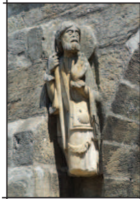
Santiago. Santa Maria de Tera.