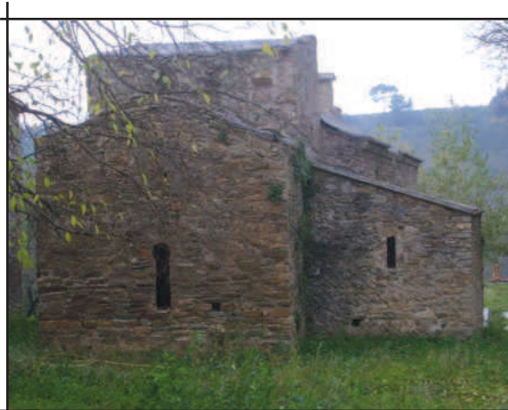
Santa Maria de Matadars

Petites esglésies: Sant Pere de Brunet i Santa Maria del Marquet (Bages), Sant Miquel de Grevalosa (Castellfollit del Boix), Sant Vicenç d'Obiols i Sant Quirze de Pedret (Berguedà), Sant Julià de Boada i Canapost (Baix Empordà), Santa Eugènia de Gomar i Sant Feliu de Savassona (Osona).