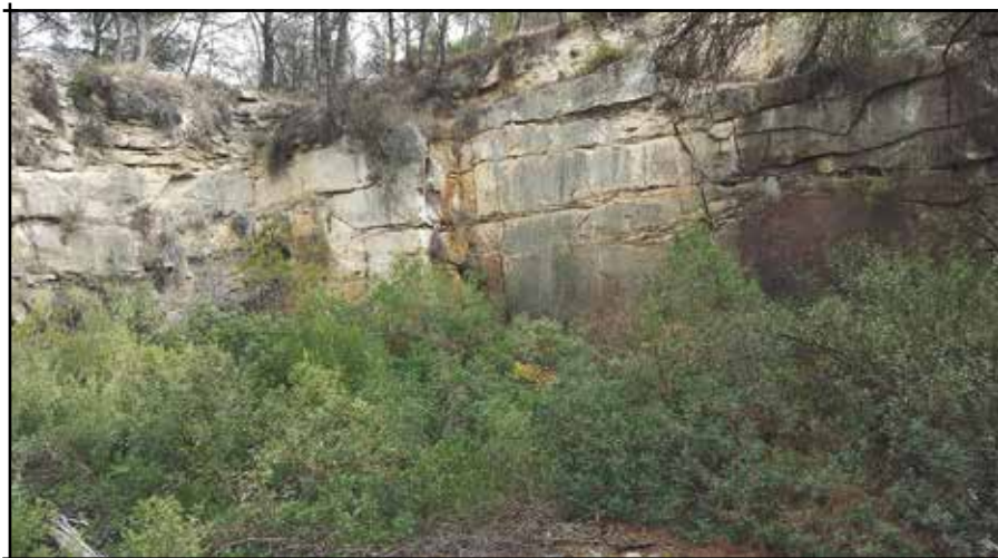
Pedrera cap del Pla de Castellgalí