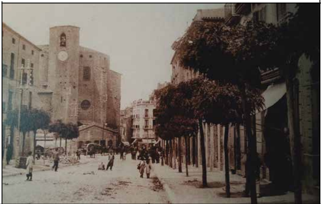
La muralla del Carme amb la primitiva església de Sant Pere Màrtir al fons i la carretera envaïda per carros i vianants, en una imatge de principis del segle XX. GARCIA, 2002, p. 544

destacar la pintura del 1650 en devoció a Sant Ignasi, de la qual es conserva la imatge central.