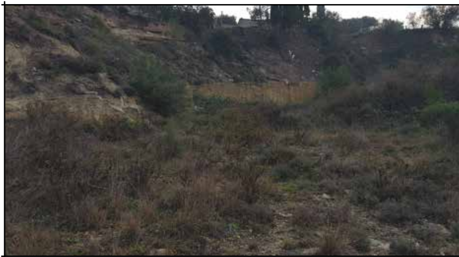
Pedrera Can Minguet darrera Torre Santa Caterina, Manresa

van explotar les pedreres per obtenir materials per a construccions properes. Citem només un exemple: el monument funerari romà de la Torre del Breny, al terme municipal de Castellgalí, fet amb enormes carreus de pedra gres, que provenen molt probablement de la pedrera de Cap del Pla, al Mas Planoi, del terme municipal de Castellgalí, ja que existeixen unes taques de piritita (òxid de ferro) en els carreus, molt semblants a les que es poden observar a la