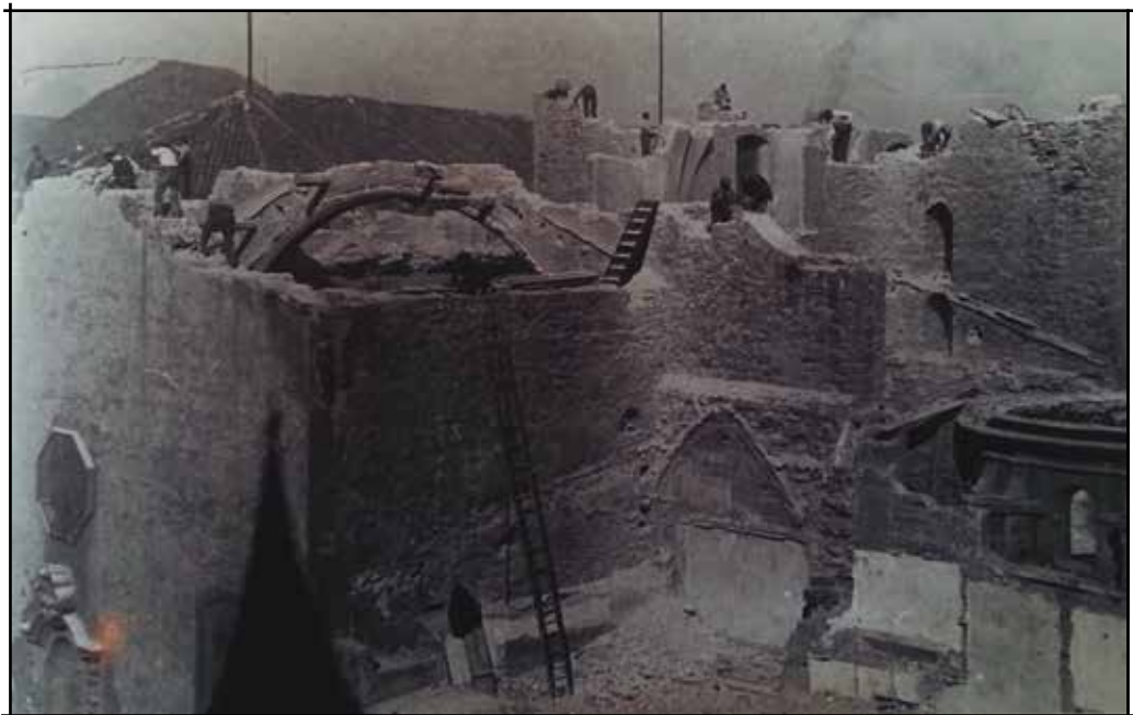
Enderrocament de l'església de Sant Pere Màrtir durant el mes d'octubre de 1936. ALOY, 1992 - 1993, V. I, p. 175

nada de la capella del Roser fins el campanar.