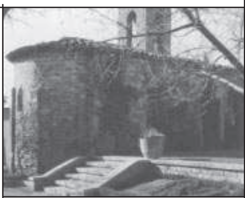
Sant Jaume dels Comtals (Manresa, 1952)