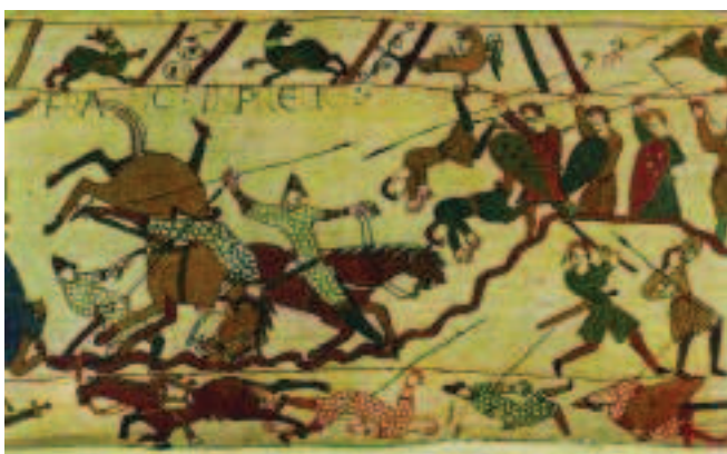
Episodi corresponent a un fragment de la batalla d'Hastings (1066) inserit dins el tapís de Bayeux (segona meitat del segle XI)

Cal assenyalar que bona part dels escuts que duïen els cavallers normands de la batalla d'Hastings eren ornats amb diverses figures, sense que encara no es puguin considerar senyals heràldics, ja que no eren representatius d'un llinatge determinat i no s'heretaven. De