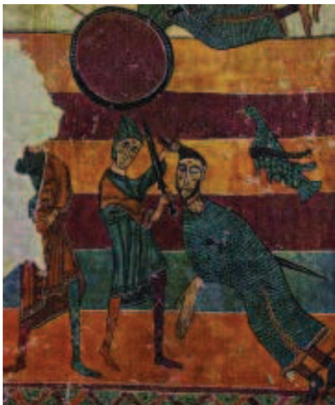
Escena que fa referència a la lluita entre David i Goliat, que havia decorat la banda sud del mur de ponent de l'església de Santa Maria de Taüll.

El casc cònic i punxegut amb l'additament de nasal es mantingué gairebé al llarg de tot el segle. El nasal, vinculat fins ara al casc, amb el pas del temps fou substituït eventualment per una careta que protegia tot el rostre. Altrament, també n'aparegueren uns altres que tenien la forma d'un casquet semiesfèric, proveïts també, sovint, de nasal i, alguns, de careta. Cal afegir que, de vegades, podien anar pintats, normalment a base de puntes curvilínies, amb alternança de dos colors. Ocasionalment també es podia prescindir de l'elm, ja que es considerava que la caputxa de malla o el capmall ja eren prou resistents. En aquest cas, se solia dur un casquet de roba sota la malla.