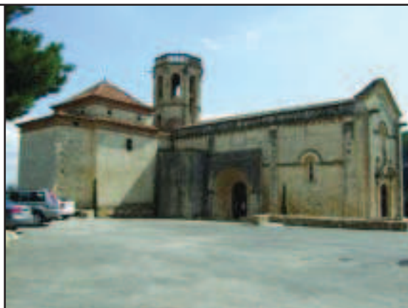
Sant Martí Sarroca

rectangular, tres absis semicirculars disposats en forma de capçalera trebolada, un gran cimbori vuitavat al centre del creuer i una coberta a la nau de canó seguit lleugerament apuntat del segle XIV que va substituir a la original del XI. L'església té configuració pròpia dels temples de monestirs però no s'han trobat restes dels edificis que formaven el cenobi. Ha estat restaurada amb força encert pel Servei de Restauració de la Diputació de Barcelona entre els anys 1957 i el 1973.