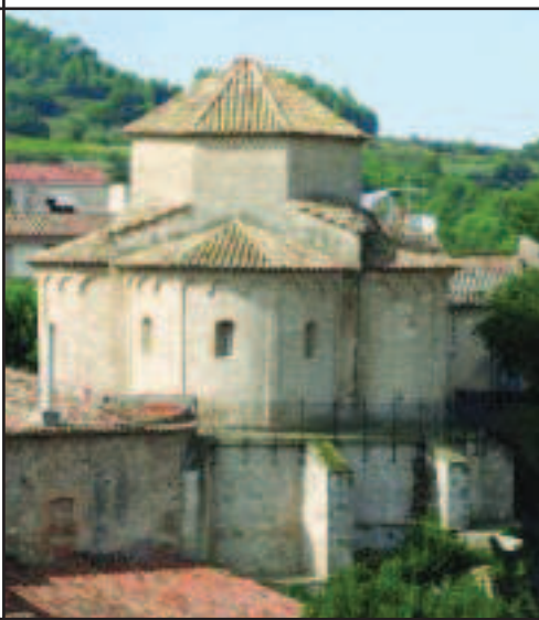
Sant Marçal de Terrassola (Torrelavit)

La primera visita “important” és la que fem a la magnífica església d'origen monacal de Sant Marçal de Terrassola ubicada en el poble de Torrelavit. Té una planta amb nau única